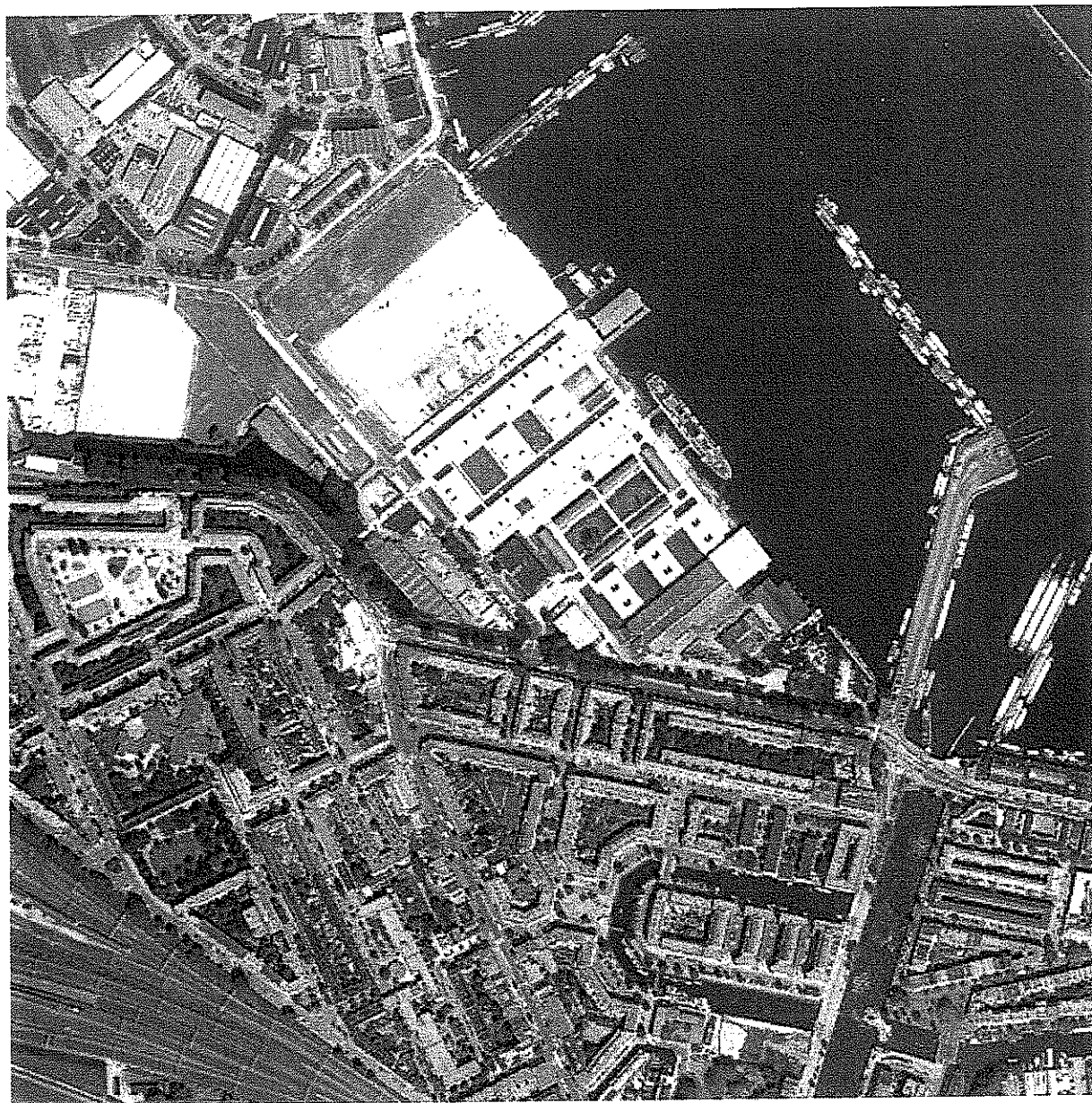
Bijlage 1.3: Luchtfoto huidige situatie